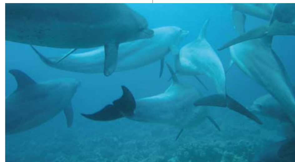
De hersenen van dolfijnen, die leven van vette vis, wegen vijf keer meer dan die van een zebra

DHA en EPA hebben niet enkel een invloed op de intelligentie, maar ook op het gedrag. Er zijn al verschillende studies gedaan die een verband aantonen tussen omega-3 tekorten en agressief gedrag. In landen waar meer vette vis wordt gegeten, komen depressie, zelfmoord en moord minder voor. Dit is echter niet alleen van belang voor volwassenen, maar ook voor kinderen. De omega-6/omega-3 verhouding in de westerse voeding is zodanig uit evenwicht, dat niet alleen volwassenen, maar ook veel kinderen omega-3 tekorten hebben.